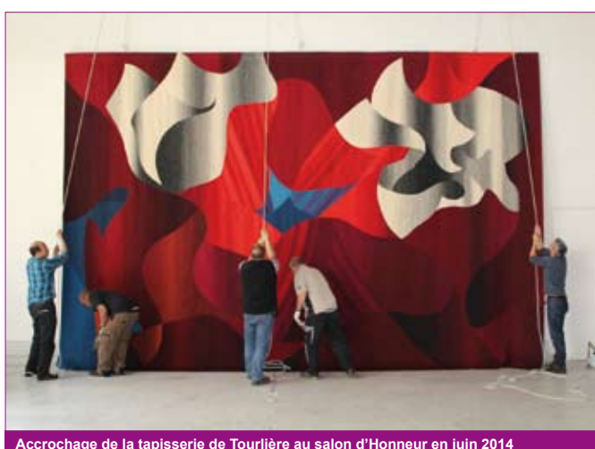
Accrochage de la tapisserie de Tourlière au salon d'Honneur en juin 2014

Un partenariat conclu avec le Mobilier National en 2014 a permis de meubler les espaces de réception avec des pièces de designers des années 60-70, renouant ainsi avec l'esprit d'origine voulu par l'architecte.