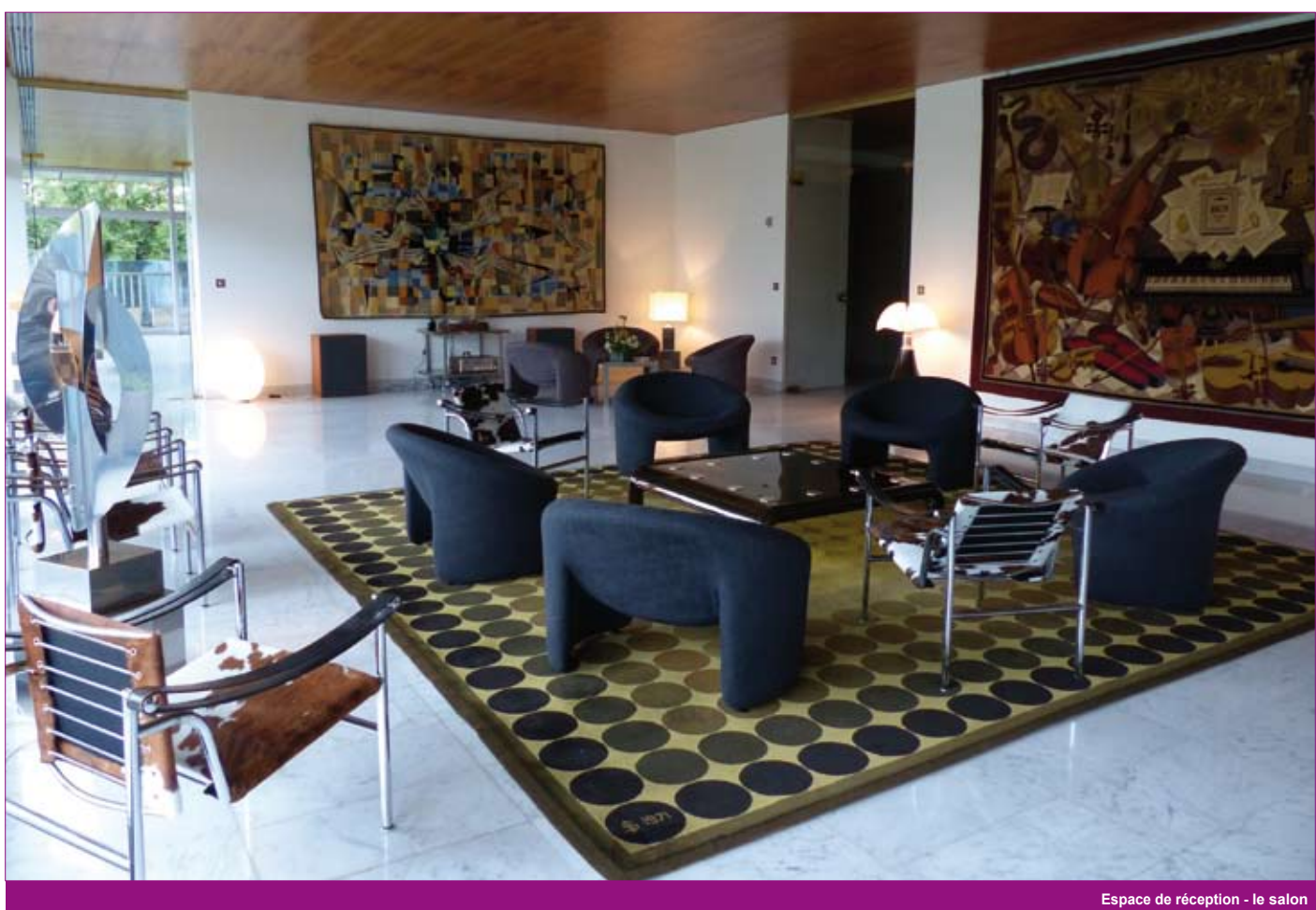
Espace de réception - le salon

basculants créées par Le Corbusier, Charlotte Perriand et Pierre Jeanneret et à un tapis de Vasarely tissé à la manufacture nationale de la savonnerie en 1971. Plusieurs tapisseries monumentales et lampes d'époque décorent les salons.