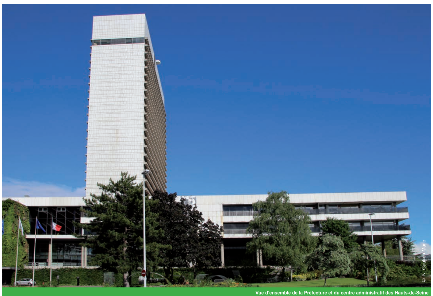
Vue d'ensemble de la Préfecture et du centre administratif des Hauts-de-Seine

(Source : La Préfecture des Hauts-de-Seine, André Wogenscky, une architecture des années 70 - SOMOGY Editions d'arts, 2006).