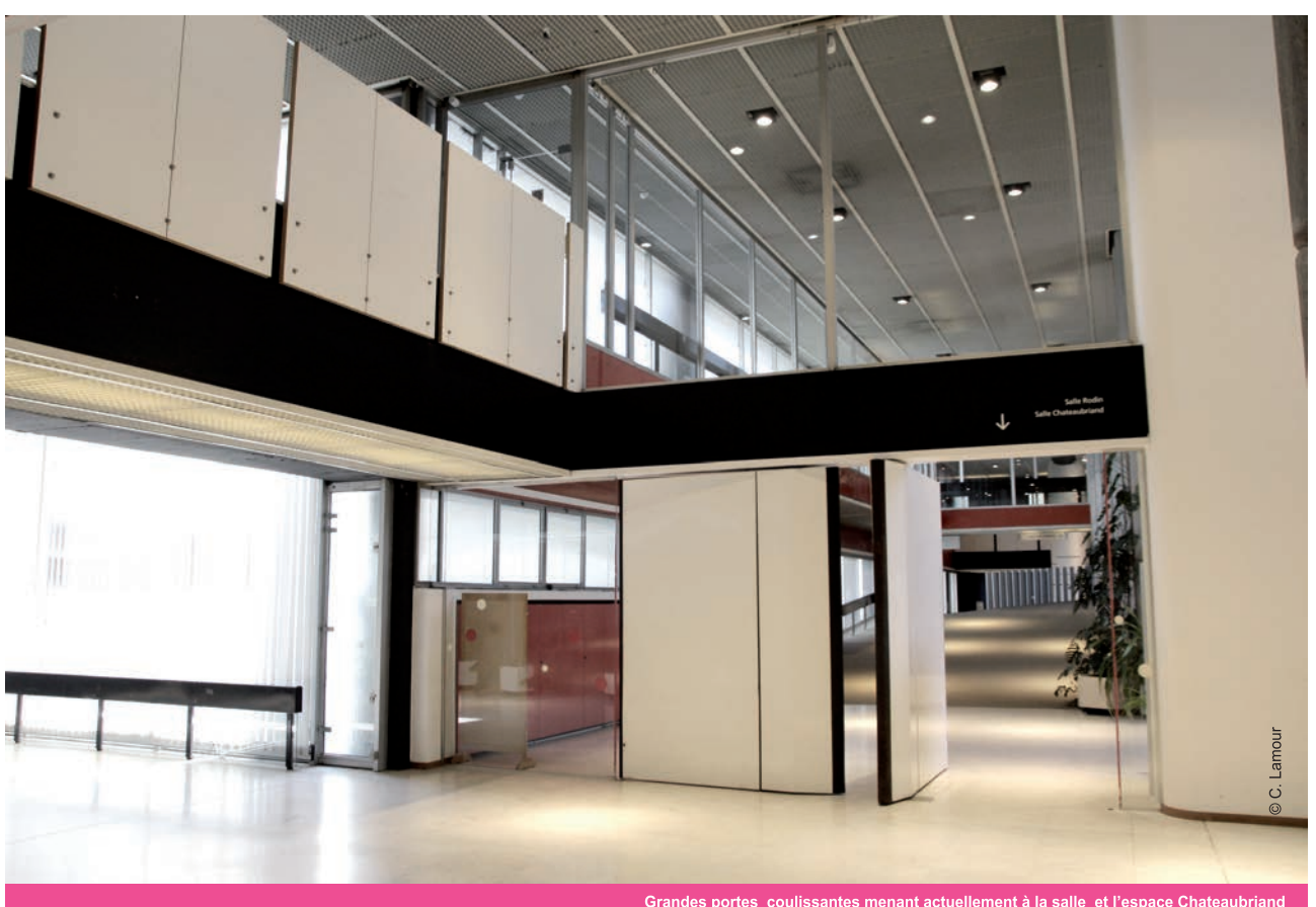
Grandes portes coulissantes menant actuellement à la salle et l'espace Chateaubriand