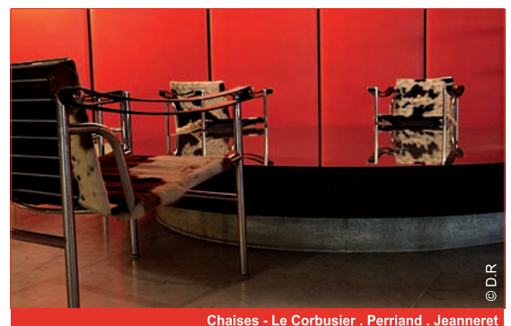
Chaises - Le Corbusier - Perriand - Jeanneret

A l'origine, l'espace était doté de chaises à dossier basculant en structure tubulaire et cuir bicolore créées par Le Corbusier , Charlotte Perriand et Pierre Jeanneret . Ces chaises étaient disposées autour des puits de lumière. Trop abîmées par le temps, les quelques exemplaires restants sont préservés à proximité du Salon d'honneur.